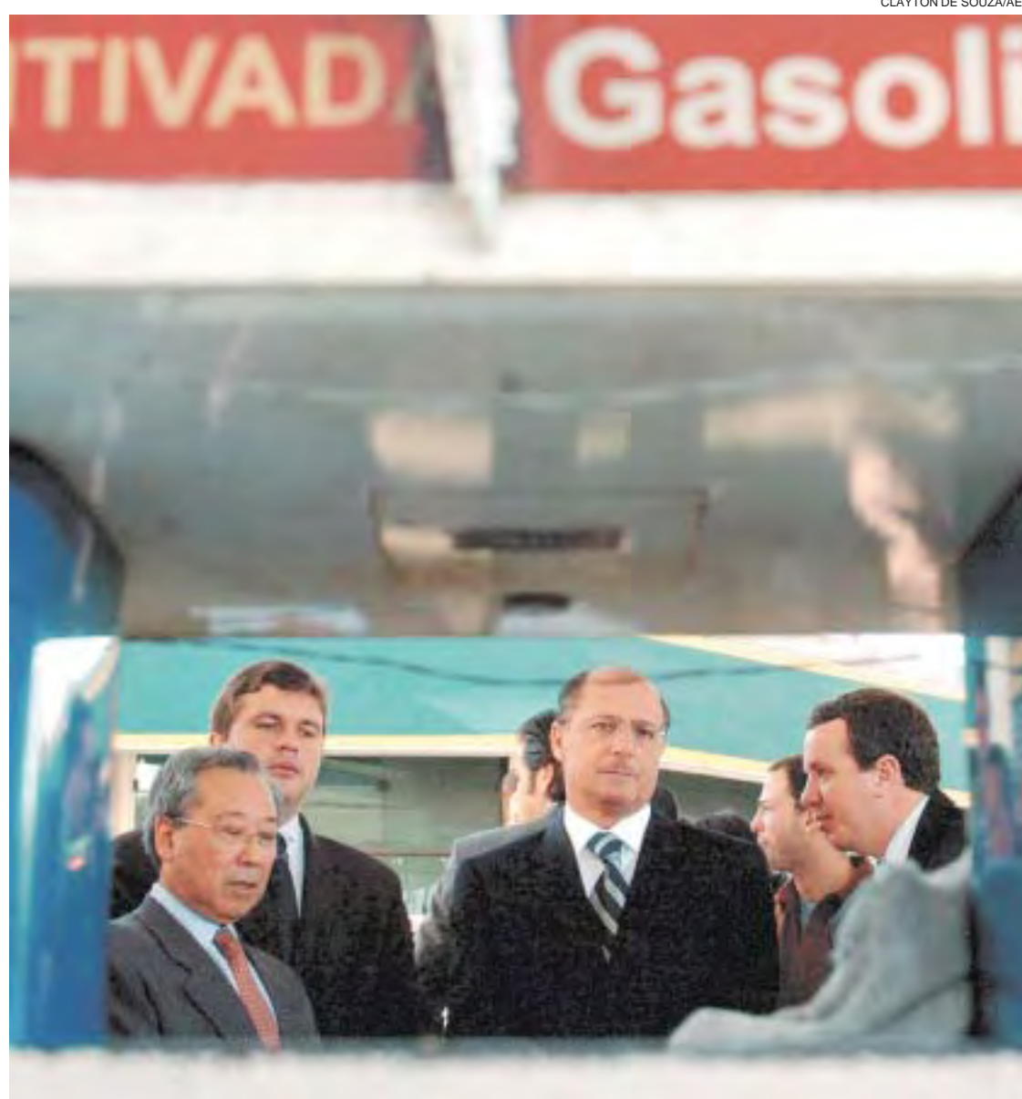
DE OLHO NA BOMBA - Alckmin em um dos postos fechados: lei protege direitos do consumidor